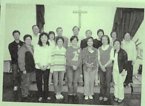
West Pennant Hills查經班